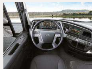
Cabina envolvente multifunción