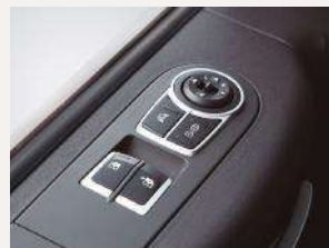
Control de vidrios y espejos eléctricos