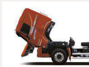
Volteo de cabina eléctrico / hidráulico