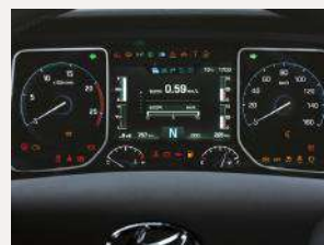
Computador a bordo con pantalla LCD TFT a color de 7"