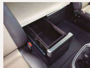
Consola de gran capacidad de almacenamiento debajo de la litera