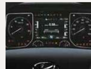
Computador a bordo con pantalla LCD TFT a color de 7"