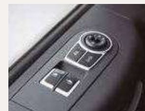
Control de vidrios y espejos eléctricos