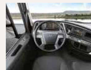
Cabina envolvente multifunción