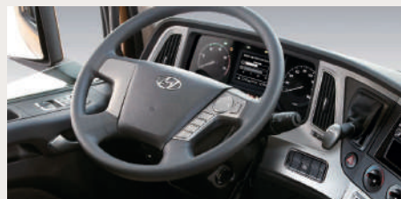
Cabina envolvente multifunción