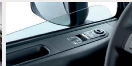
Computadora a bordo y vidrios eléctricos